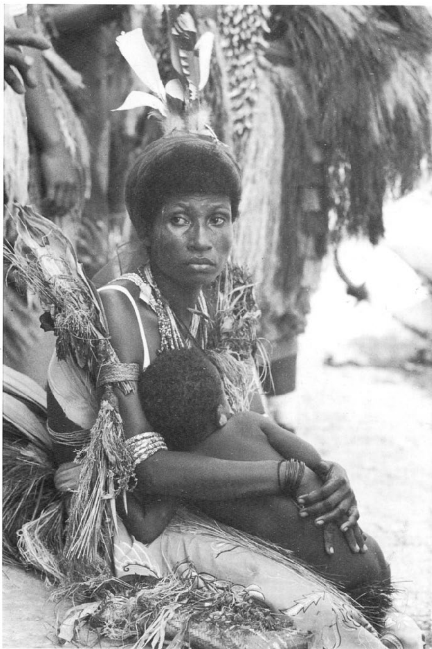
Planșa 1. Mamă și copil din ținuturile litoralului nordic al Noii Guinee (insula Siar).